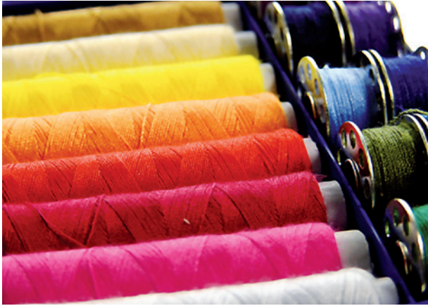
Auch textiles Garn ist rezyklierfähig.

Rebound-Effekte werden nur vermieden, wenn qualitativ und funktional gleichwertige Textilien aus Rezyklatfasern die Primärfaserprodukte vollständig ersetzen. Zudem dürfen kreislauffähige B2B-Textilien und assoziierte Dienstleistungen sowie Textilrohstoffe und -zwischenprodukte nicht günstiger als ihre konventionellen Pendanten angeboten werden.